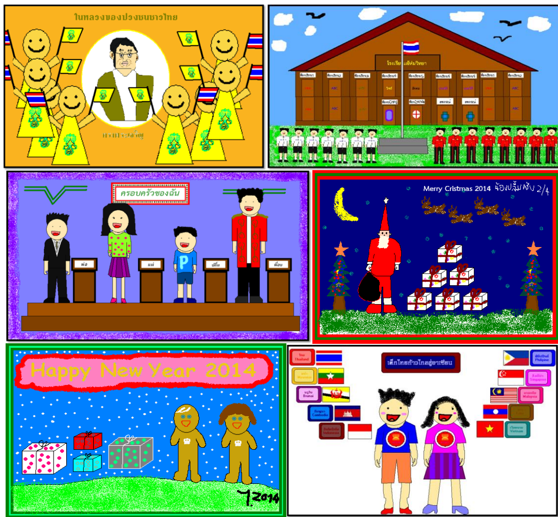
ภาพที่ 1 ตัวอย่างผลงานการสร้างสรรคทางศิลปะของเด็กออกทิสติกผ่านโปรแกรมเพ้นท์