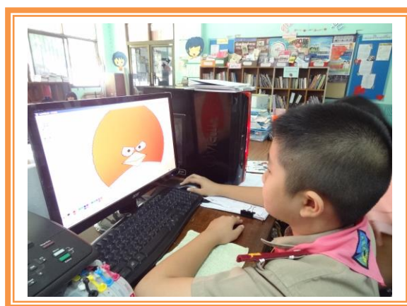
ภาพที่ 2 ภาพขณะการปรับพฤติกรรมเด็กออทิสติกผ่านการใช้โปรแกรมเพ้นท์