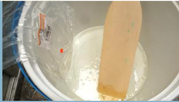
เทหัวนมลงไป