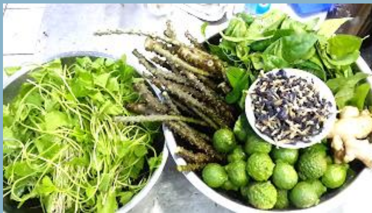
สมุนไพรที่ใช้ครั้งนี้