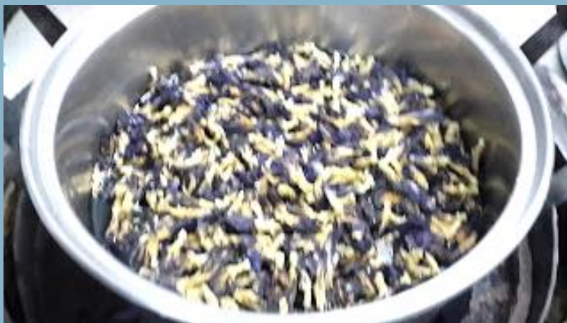
อัญชันแบบแห้ง ใส่น้ำต้มแล้วกรองเอาแต่น้ำ