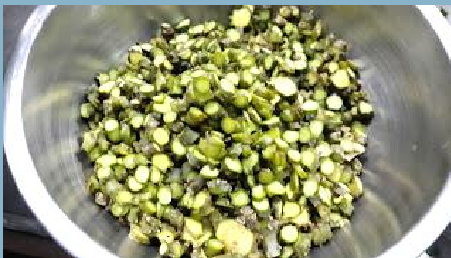
บอระเพ็ด หั่น ใส่น้ำปั้น ต้ม กรองเอาแต่น้ำ