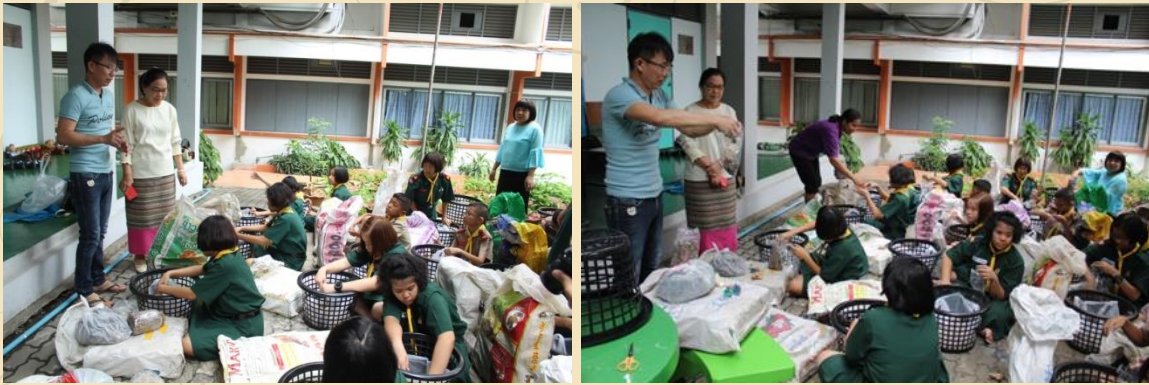
การฝึกปฏิบัติการเพาะเห็ดในตะกร้า โดยวิทยากรผู้เชี่ยวชาญจากศูนย์รวมเห็ดบ้านอัญญะอุกชุมชนคนรักเห็ด