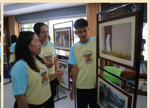
จัดแสดงผลงานภาพถ่ายของนักเรียน