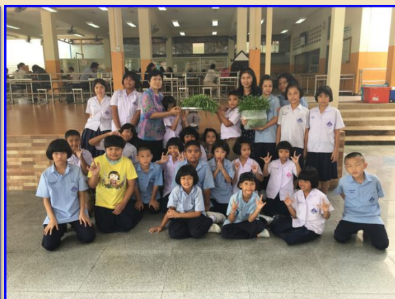
การนำพืชผักสวนครัวที่ปลูกได้มาใช้ประโยชน์ในการทำอาหารกลางวัน