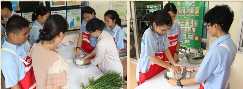
การเตรียมแป้ง การนวดแป้ง