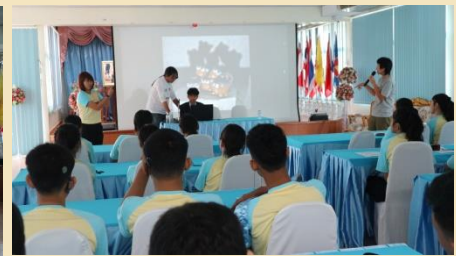
การฝึกอบรมอาชีพการถ่ายภาพ