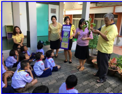
ให้ความรู้เรื่องการปลูกผักสวนครัว