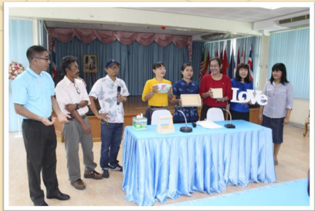
พิธีเปิดและการแนะนำวัสดุต่างๆ ในการทำกิจกรรม