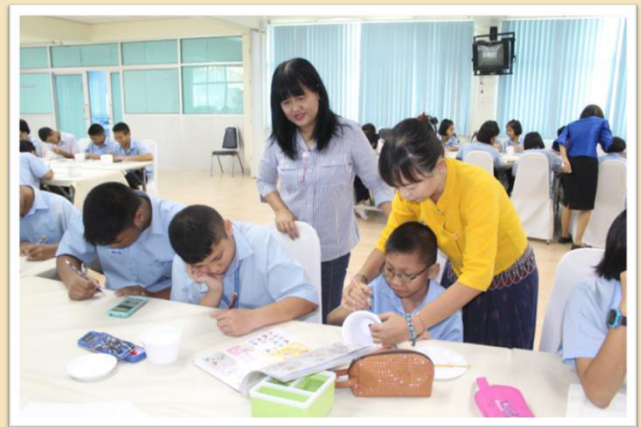
เรียนรู้และลงมือปฏิบัติ