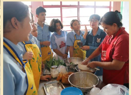
การสาธิตการทำขนมฟักทองสังขยา