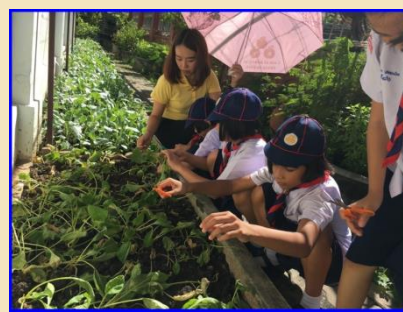
การดูแล รดน้ำ พืชผักสวนครัว