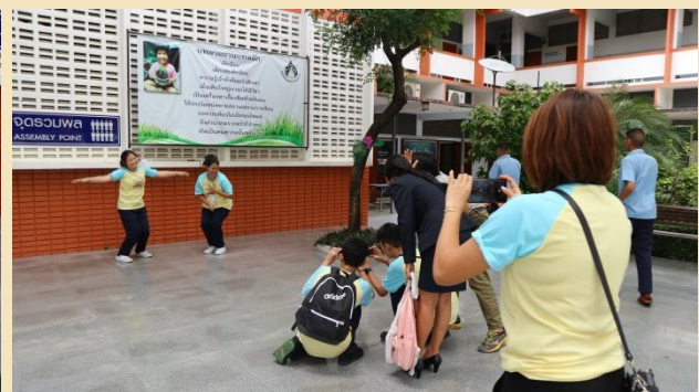
ฝึกปฏิบัติการถ่ายภาพ