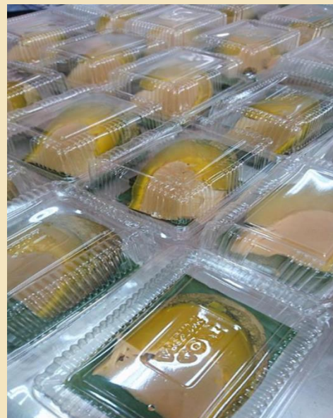
ขนมฟักทองสังขยาพร้อมรับประทาน