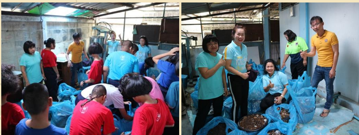
การสาธิตการฝึกปฏิบัติ และการเก็บรักษา